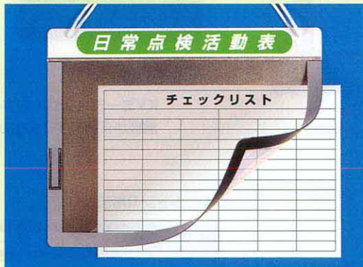
168-B ●A3ヨコ用 375×475