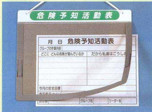
169-B ●A3ヨコ用 375×475