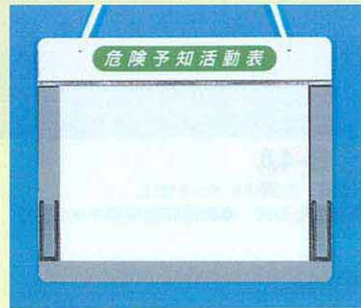
169-C ●A4ヨコ用 290×350