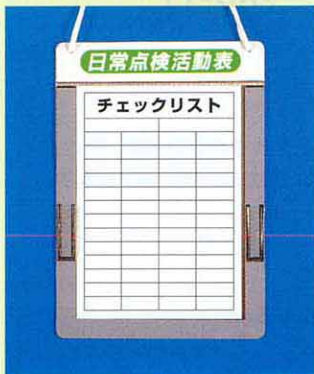
168-A ●A4タテ用 375×265