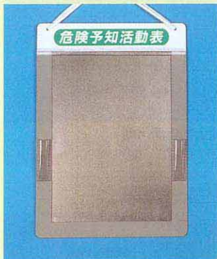
169-A ●A4タテ用 375×265