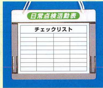
168-C ●A4ヨコ用 290×350

チェックボード用掲示板 940×1840 木枠付耐水ベニア・アルミ枠仕上 (単管用設置金具付)