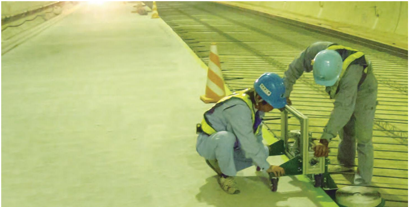
▲キッシーラー1401(専用機械使用)貼り付け状況

キッシーラー1401は、柔軟性および粘着性を有する自着性コンパウンドです。キッシーラー1401中の活性基と生コンクリート中の金属酸化物とが反応して、生コンクリートの硬化と共にコンクリートと接着し止水効果を発揮する止水材です。