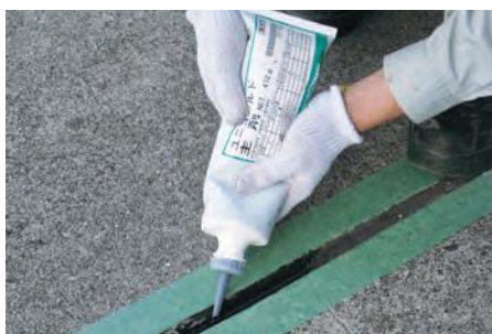
▲土間目地の充填に