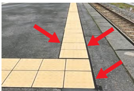
▲舗装と点字ブロックの目地に