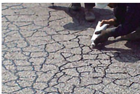
▲アスファルトクラックの補修に