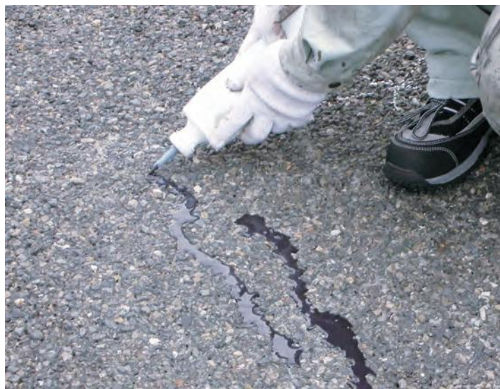
▲アスファルト舗装のクラック充填に

常温施工タイプなので、火気を使用せず、安全に施工できます。加熱施工タイプに比べて、煙やCO 2 の発生もなく、環境に配慮した製品です。