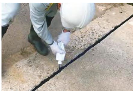
▲橋梁伸縮部の充填に