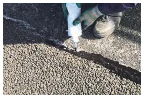
▲舗装とシールコンの境界目地(防草)に